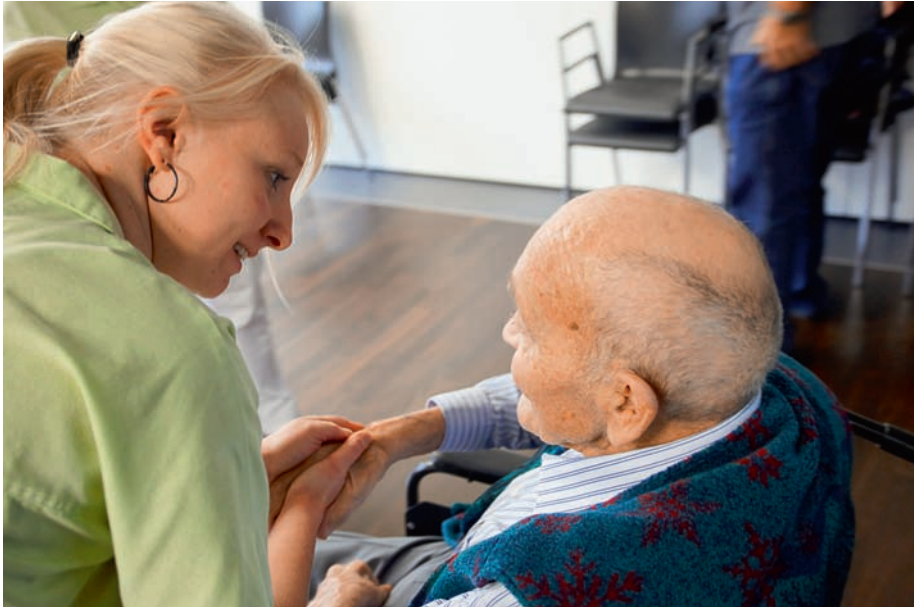
Im Gespräch machen spezielle geschulte Pflegefachpersonen die Patienten auf die Möglichkeit einer Patientenverfügung aufmerksam.